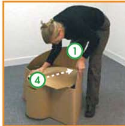
Bloquer l'assise contre la pièce "n°1"...