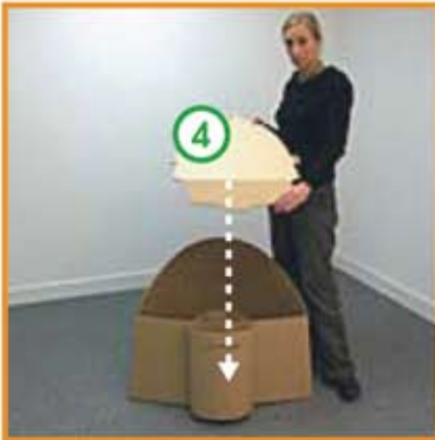
Poser l'assise (pièce n° "4") sur la structure.