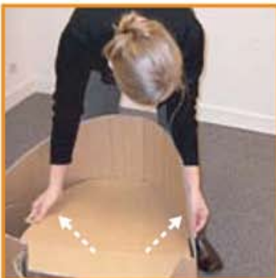
Répéter l'opération "Verrou / Cheville" sur chacun des deux côtés de l'assise.