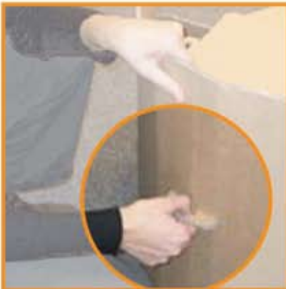
... en faisant passer le "verrou" de l'assise dans l'orifice prévu à cet effet.