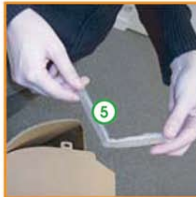
Replier la pièce "n°5" en deux et l'utiliser comme une cheville. La glisser dans le verrou.